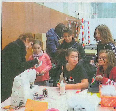
Le rendez-vous "Bonne journée, bonne santé", organisé par le réseau "Grandir en Matheysine", s'est déroulé samedi au gymnase de La Motte-d'Aveillans.